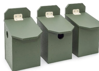
Set van 3 nestkastjes voor huismussen

Wanneer u mee wilt werken aan deze actie voor de huismussen, dan verzoeken we u dit zo spoedig mogelijk, uiterlijk voor 10 juli 2017 kenbaar te maken door te mailen naar stadsecologen@rotterdam.nl , onder vermelding van uw naam, adres en telefoonnummer. Ook kan u bellen met het projectinformatienummer 010-489 4334.