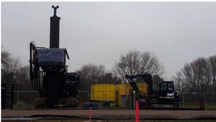
Machine voor aanbrengen fundatiepalen unit

Deze week zijn de fundatiepalen voor de unit voor de gelijkrichter-/beveiligingsinstallatie aangebracht. Dit is uitgevoerd met een trillingvrije fundatiemethode.