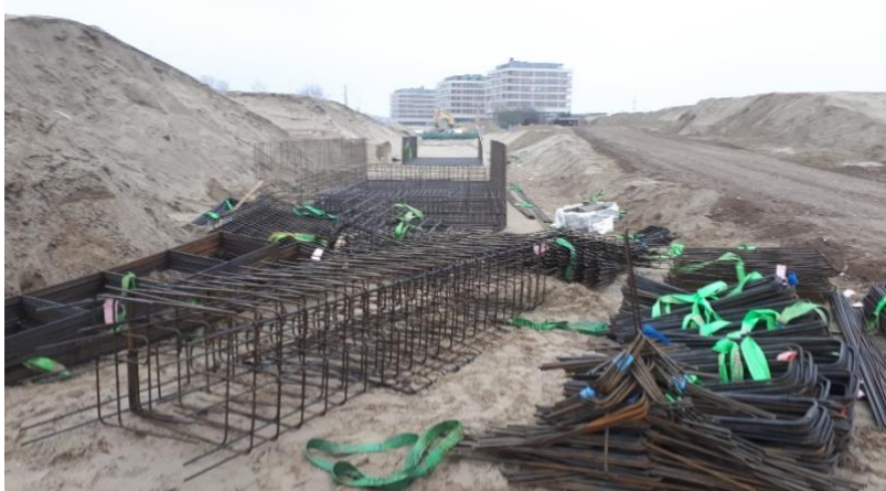
Staalvlechtwerk voor open bak

Aan de westzijde van de Strandboulevard is voor de eerste 2 moten voor de open bak het staalwerk gevlochten. Naar verwachting kan nog dit jaar hier beton gestort worden.