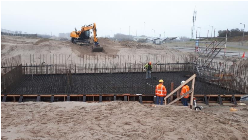
Keldervloer station Hoek van Holland Strand