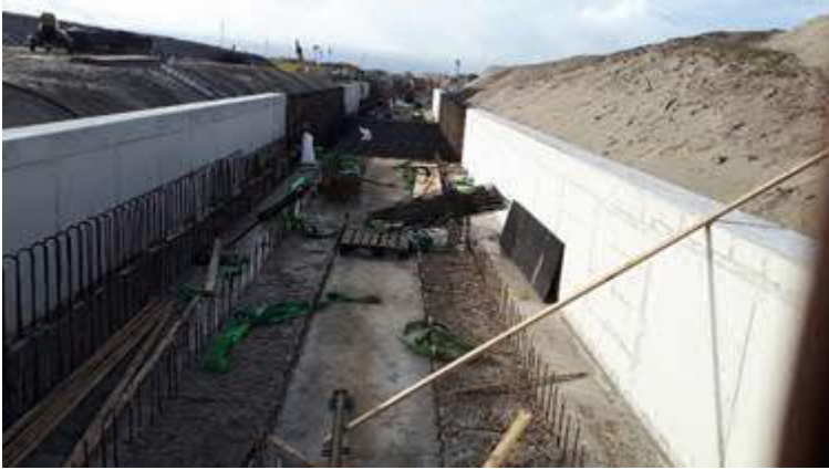
Bouw Open bak westzijde Strandboulevard