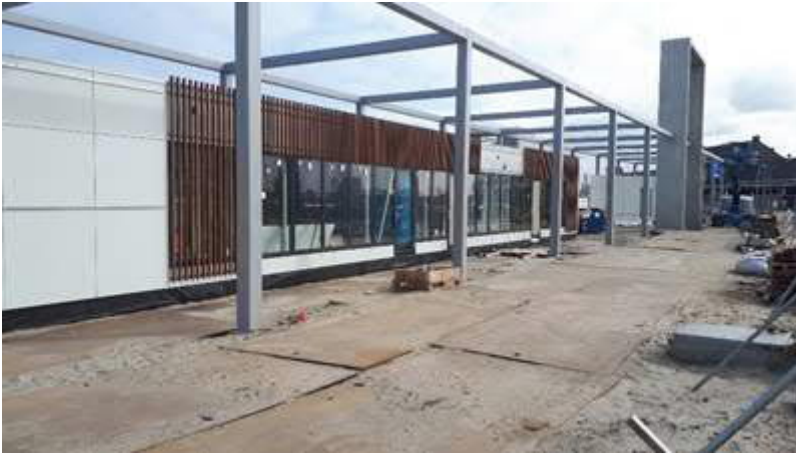
Bouw algemene ruimten Station HvH Haven