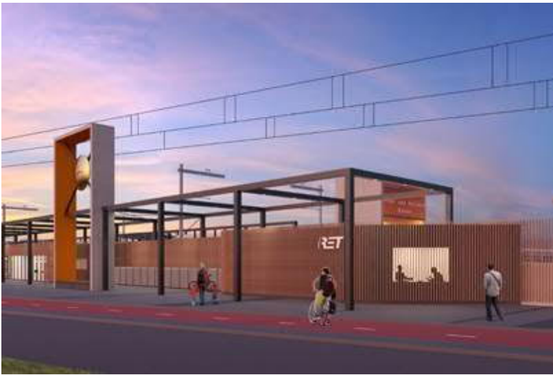
Artist impressie station HvH Haven