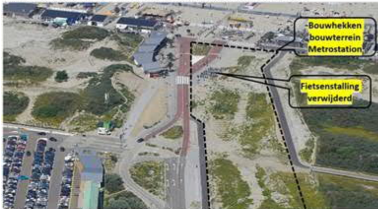
Badweg versmalling naar Zeekant – fase 2 vanaf voorjaar 2021