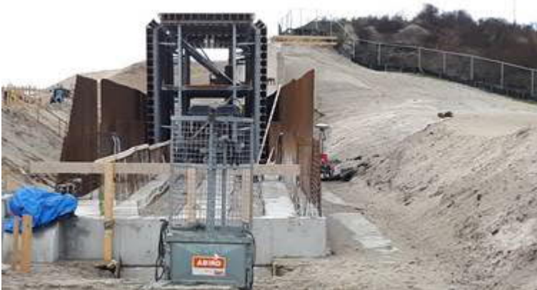
Bouw tunnelementen Strandweg

Bij de Strandweg wordt volop gewerkt aan de bouw van de tunnelementen.