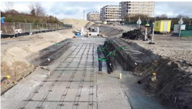
Start bouwmoten spoorwegovergang Strandboulevard