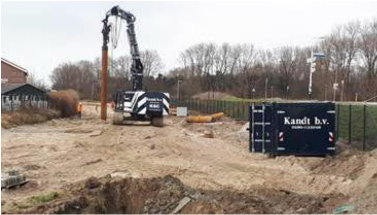
Boren funderingspalen spoorbaan nabij station HvH Haven.