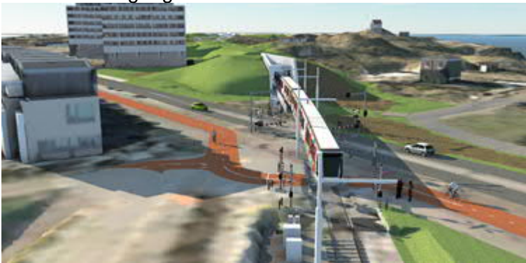
Artist impressie spoorovergang Strandweg

Hierna is er voor gemotoriseerd verkeer geen verbinding meer tussen de Strandweg en de Stationsweg. Wel voor voetgangers en fietsers.