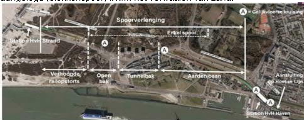
Schematisch overzicht van de werkzaamheden

ABSaanZee, de aannemerscombinatie bestaande uit Boskalis Nederland en Swietelsky Rail Benelux, bouwt in de komende tijd door aan het laatste deel van de verlenging van de 'Hoekse Lijn'. Dit is het deel tussen de Stena Line terminal en het strand van Hoek van Holland. Er wordt een nieuw eindstation, 'Station Strand', gebouwd, een tunnelbak, achter de 4 appartementencomplexen aan de Stationsweg, een deel van het spoor komt in een zogenaamde 'open tunnelbak' en een deel van de lijn wordt verhoogd aangelegd (blokkenspoor) i.v.m. het verwaaien van zand.