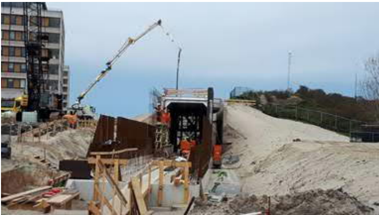
Bouw tunnelementen Strandweg

Deze week is aanvangen met het verwijderen van een deel van de voorbelasting. De resterende voorbelasting wordt vanaf medio mei verwijderd.