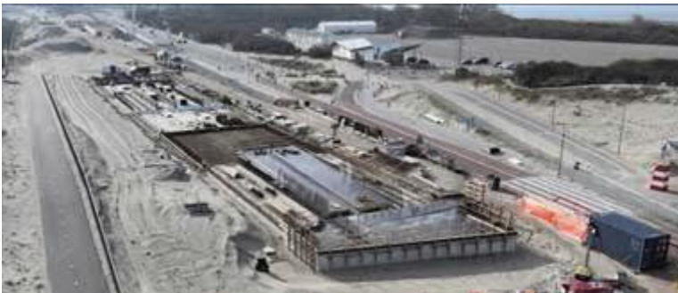
Bouw metrostation HvH Strand

Voor de bouw van het station Hoek van Holland Strand wordt nu gewerkt aan de perrons. Delen van het station HvH-strand worden in de fabriek geproduceerd en ter plaatse gemonteerd, maar worden grotendeels in de nacht aangevoerd.