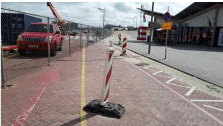
Afsluiting Badweg met bouwhekken