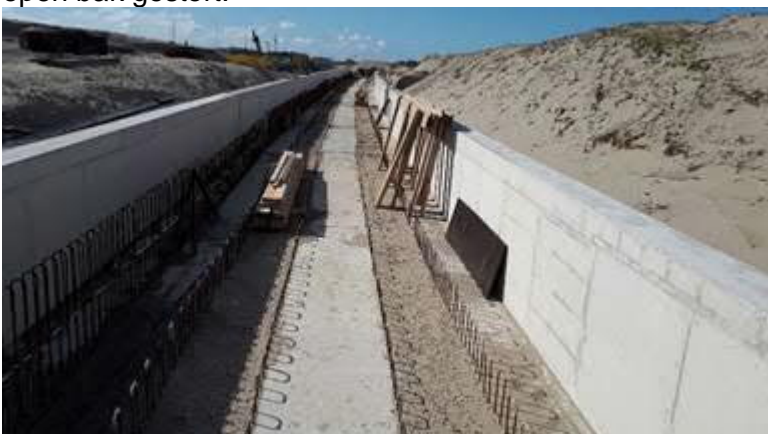
Bouw Open bak westzijde Strandboulevard

Aan beide zijden van de Strandboulevard, worden de vloeren en wanden voor de betonmoten voor de open bak gestort.