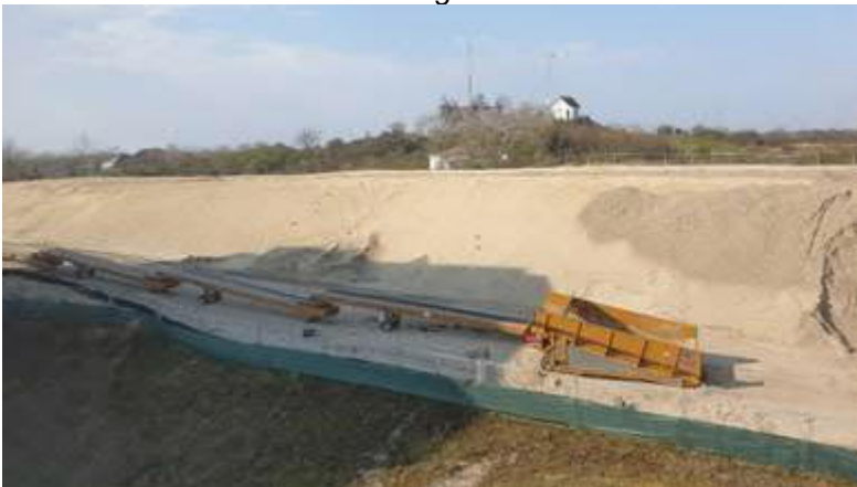
Verwijderen voorbelasting Strandweg.