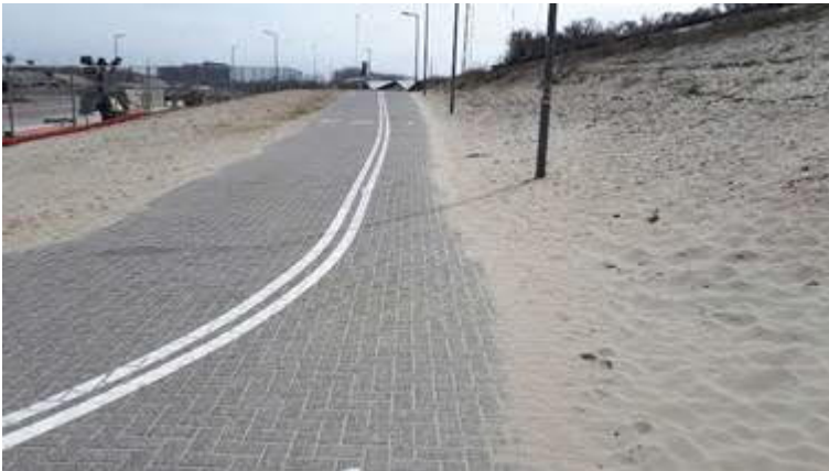
Strandslag naar de Zeekant wordt voetgangersgebied (fietsers afstappen)