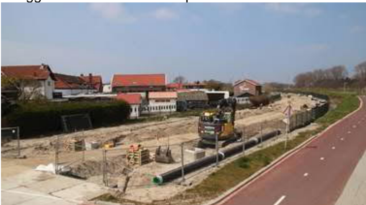
Aanbrengen infiltratiebuizen in spoorbaan

Er is beton gestort voor de funderingen voor de hoge geluidsschermen en voor de palen van de bovenleiding. In de komende weken worden er kabel- en leidingwerkzaamheden uitgevoerd en worden infiltratiebuizen en mantelbuizen ingegraven. Vervolgens wordt de spoorbaan afgewerkt en kunnen de dwarsliggers, rails en het ballastmateriaal (nadat het op het parkeerterrein Badweg gezeefd is) weer teruggebracht worden in de spoorbaan.