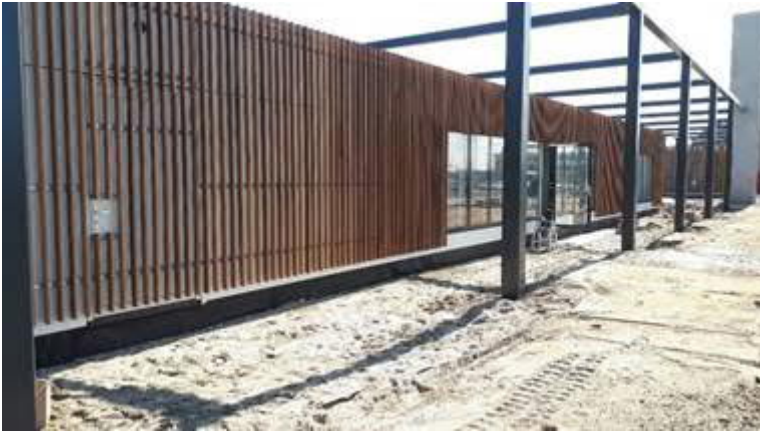
Algemene ruimten Station HvH Haven