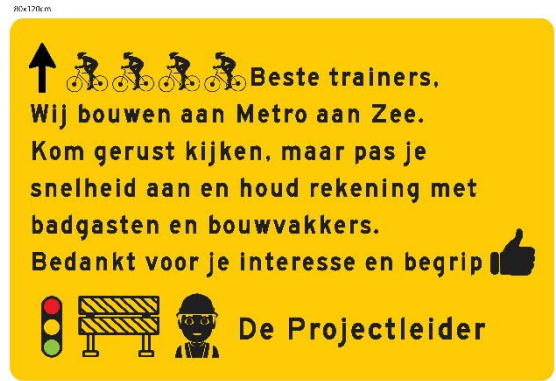
Adviesfietsroute doorgaande fietsers

Deze aanpassingen zijn nodig omdat er meer ruimte nodig is voor de bouw van het metrostation HvH Strand en de betonnen wanden in het plein voor het station. De bouwhekken zijn inmiddels over de rijweg van de Badweg geplaatst. Deze situatie blijft gehandhaafd tot begin oktober 2021. Dan wordt gestart met de aanleg van het plein voor het metrostation Hoek van Holland Strand.