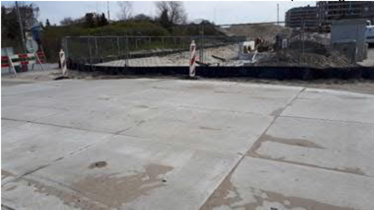
Tijdelijke betonplaten over spoorovergang Strandboulevard

Vooralsnog zijn er betonplaten over de onderbouw van de spoorovergang aangebracht. In september worden de rails en de bovenbouw van deze spoorwegovergang aangebracht.