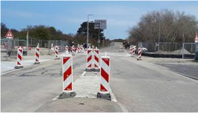
Strandboulevard weer open voor al het verkeer

Vooralsnog zijn er betonplaten over de onderbouw van de spoorovergang aangebracht. In september worden de rails en de bovenbouw van deze spoorwegovergang aangebracht.