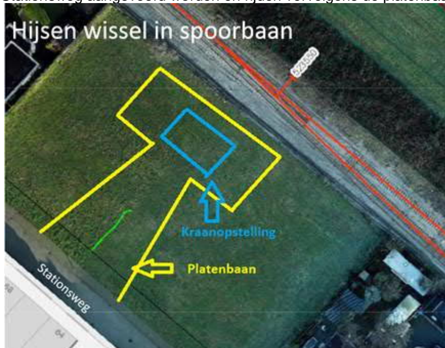
Schets inbrengen wissel in spoorbaan vanaf Stationsweg

In week 21, vanaf dinsdag 25 mei wordt er aan de Stationsweg tussen perceel 81 en 101 een wissel aangebracht. Dinsdag wordt de platenbaan aangebracht. Woensdag vanaf 7.00 uur wordt de kraan opgesteld en worden de materialen voor de rails aangevoerd en in de spoorbaan gehesen. Donderdag wordt de kraanopstelling afgebroken. De kraan en vrachtauto's zullen vanaf de Hoeksebaan en Stationsweg aangevoerd worden en rijden vervolgens de platenbaan op.