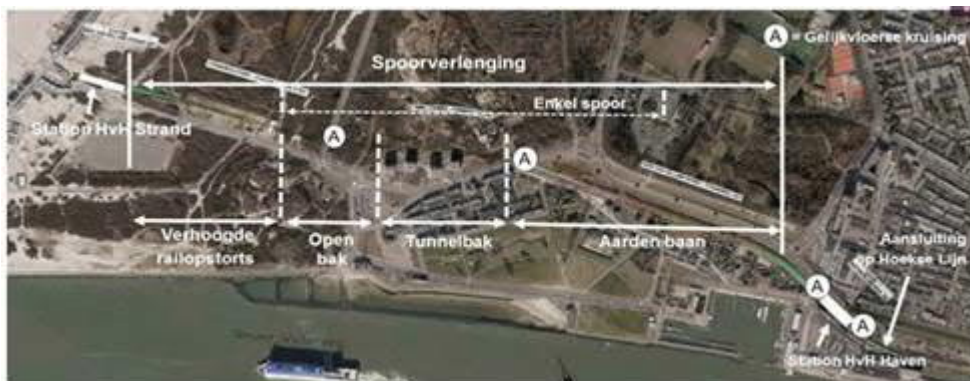
Schematisch overzicht van de werkzaamheden

De aanleg van Metro aan Zee vordert gestaag. In de afgelopen maanden is al veel werk verzet voor de spoorverlenging. De metrobaan en de tunnelbak in de duinen zijn in aanbouw. De ruwbouw van metrostation Hoek van Holland Haven en de algemene ruimtes in de plint is klaar, tijd voor de afbouw. Vlakbij zee krijgt het nieuwe metrostation Strand stap voor stap vorm. Na het Hemelvaartsweekend volgt een nieuwe mijlpaal: de aanleg van de twee spoorwegovergangen bij station Haven en het plaatsen van de eerste rails van de spoorlijn naar het strand. Dit is een ingrijpende operatie, waarbij de aannemer zwaar materieel gebruikt. Voor de veiligheid van iedereen gelden daarom verkeersmaatregelen die tijdelijk tot hinder kunnen leiden.