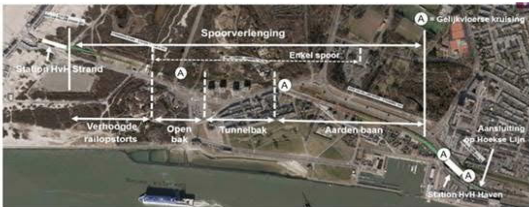
Schematisch overzicht van de werkzaamheden

De aanleg van Metro aan Zee vordert gestaag. In de afgelopen maanden is al veel werk verzet voor de spoorverlenging. De metrobaan en de tunnelbak in de duinen zijn in aanbouw. De ruwbouw van metrostation Hoek van Holland Haven en de algemene ruimtes in de plint is klaar, tijd voor de afbouw. Vlakbij zee krijgt het nieuwe metrostation Strand stap voor stap vorm. De komende week vindt voor de bouw van metrostation Strand avond- en nachtwerk plaats.