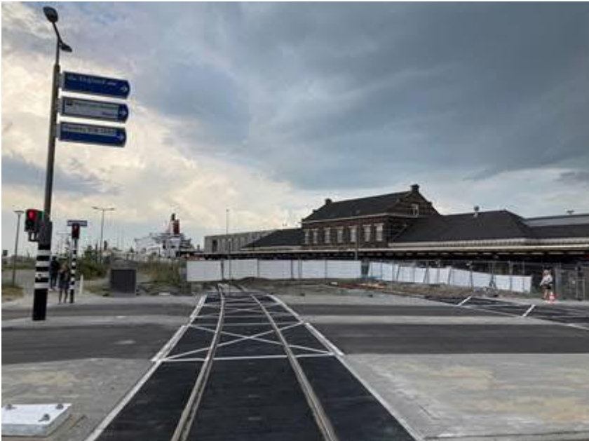
Vrijdag 18 juni is de kruising Hoeksebaan weer opengesteld voor verkeer