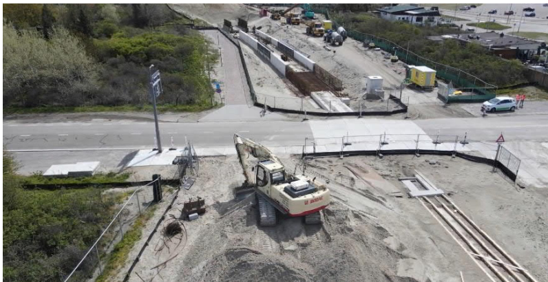
Tijdelijke spoorovergang Strandboulevard

In de eerste week van september - Vanaf 6 t/m 9 september 2021 - wordt de Strandboulevard voor één week afgesloten voor het aanbrengen van de rails en het aanhele van het asfalt tussen en aan de rails.