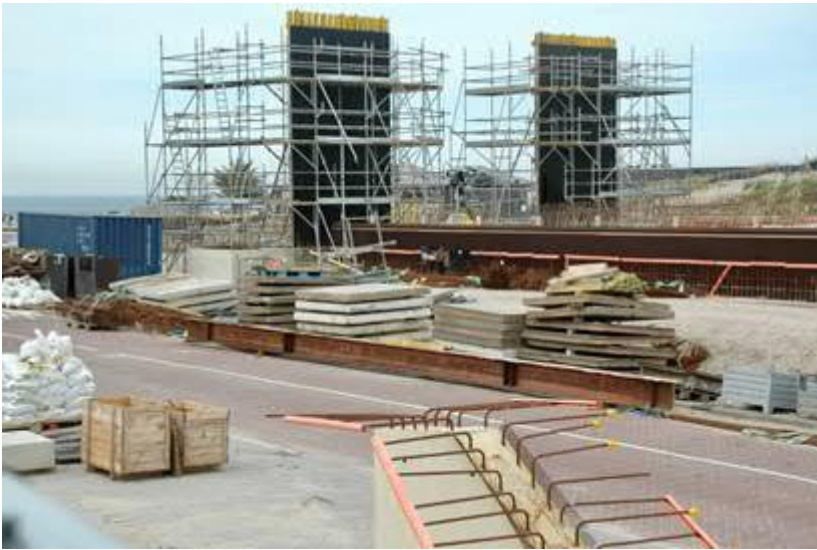
Bouw station Hoek van Holland Strand

aangevoerde materiaal wordt ter plaatse door een telekraan gelost en op zijn plaats gelegd. Hierbij zal geluid te horen zijn door het slaan van zogenaamde wiggen. Die wiggen zijn nodig om de bekisting op zijn plek te zetten. De boorwerkzaamheden die hier voorafgaand voor nodig zijn, worden overdag uitgevoerd. De lichtmasten worden in de avond en nacht lager gezet, zodat er geen onnodig licht, en dus overlast, richting het Natura 2000-gebied zal plaatsvinden.