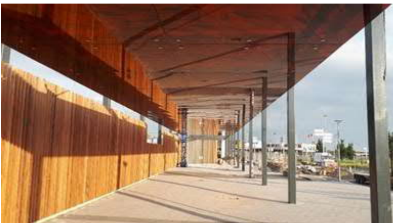
Plint Station HvH Haven met aangebracht platen boven de te realiseren fietsenstalling