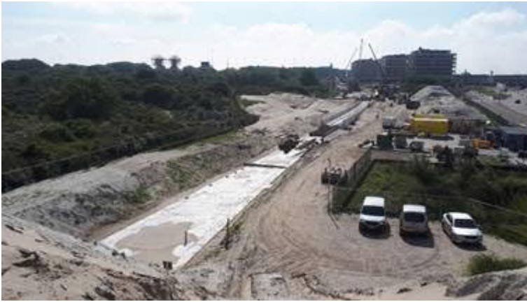
Aanleg fundering wissel bij station HvH Strand