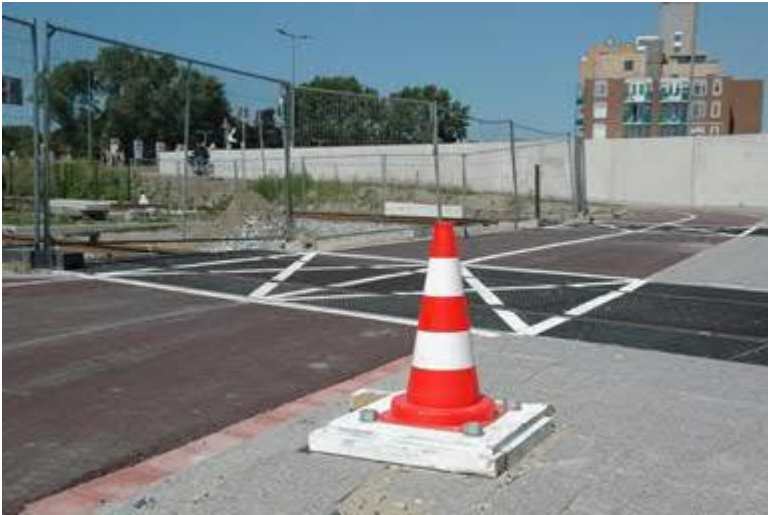
Spoorovergang Harwichweg voor fietsers en voetgangers is gerealiseerd