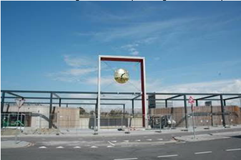
Plint Station HvH Haven met aangebracht klok

De Algemene ruimten in de plint van het Station Hoek van Holland Haven nadere hun voltooiing. Onlangs is hier de klok aangebracht, het portaal geverfd en de platen boven de fietsenstalling aangebracht.