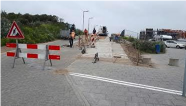
Verbreiden strandslag tussen parkeerterrein en strand voor voetgangers en fietsers.