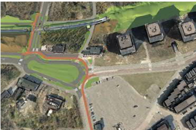
Artist Impressie van de "ovonde" aan het begin van de Badweg.