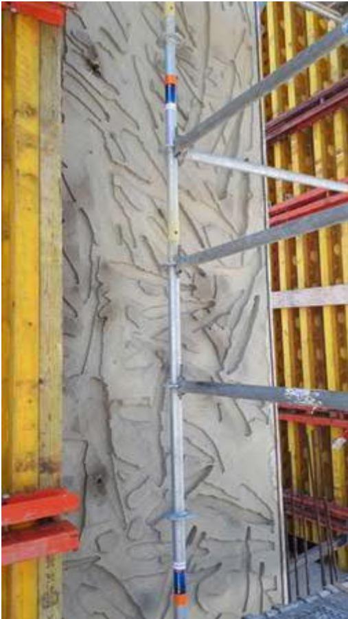
Prefab element met structuur vormen voor station HvH Strand