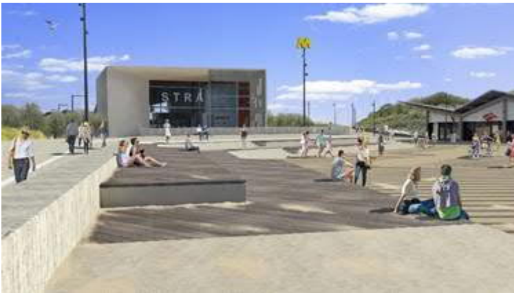
Begin oktober wordt gestart met het plein voor het station HvH Strand

Medio augustus worden er voorbereide werkzaamheden uitgevoerd. Er worden dan paddenschermen geplaatst rond het werkgebied geplaatst. Dit is nodig om begin oktober te starten met de uitvoering van het plein voor het in aanbouw zijnde Station Hoek van Holland Strand en de "ovonde" (ovale rotonde) op de kruising van de Badweg, Strandboulevard, Koning Emmaboulevard en Strandweg.