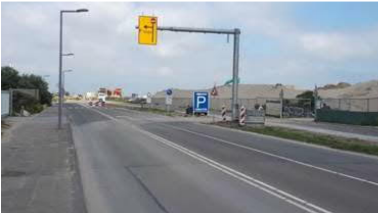
Badweg extra bewegwijzering

Om het verkeer naar het strand beter te geleiden is extra bewegwijzering in de Badweg aangebracht. Er wordt hard gewerkt aan de verbreding van de “strandslag” tussen het parkeerterrein en het strand. Hierdoor krijgen voetgangers en fietsers hun eigen strook op hun route van of naar het strand.