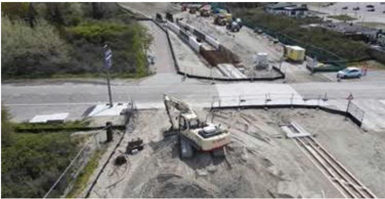
Tijdelijke spoorovergang Strandboulevard

In de eerste week van september - Vanaf 6 september 2021 - wordt de Strandboulevard voor één week afgesloten voor het aanbrengen van de rails en het aanhalen van het asfalt tussen en aan de rails. Al het verkeer wordt omgeleid.