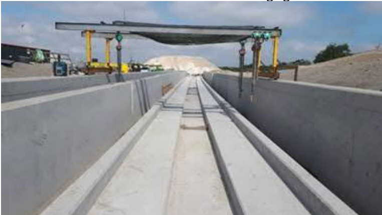
Open bak westzijde Strandboulevard

In de komende weken wordt hier zand afgegraven zodat ook hier het blokkenspoor aangelegd kan worden.