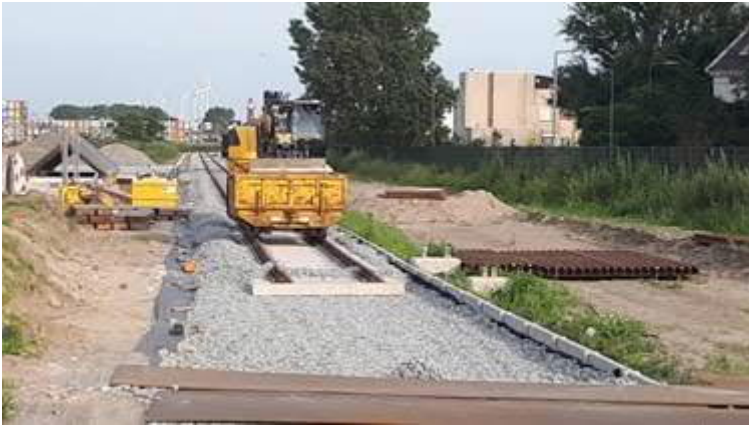
Spoorbaan HvH Haven -Strandweg