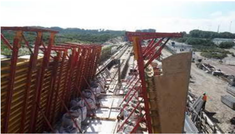
Bouw station Hoek van Holland Strand – bekistingen zijwanden

Hier wordt gewerkt aan de perrons en wanden van het station. De hoge bekistingsdelen voor de zijwanden van het station geven een indruk hoe het station HvH Haven er uiteindelijk uit gaat zien. Delen van het station voor HvH-Strand worden in de fabriek geproduceerd en ter plaatse gemonteerd (aangevoerd in de nacht). De eerste van deze prefab delen zijn afgelopen week aangevoerd en gemonteerd.