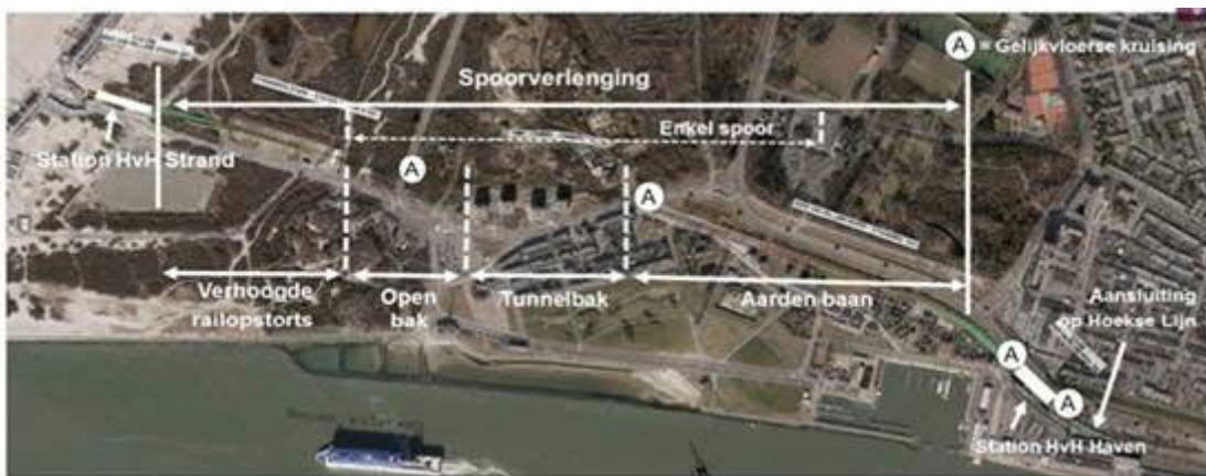
Schematisch overzicht van de werkzaamheden

De aanleg van Metro aan Zee vordert gestaag. In de afgelopen maanden is al veel werk verzet voor de spoorverlenging. De metrobaan en de tunnelbak in de duinen zijn in aanbouw. De ruwbouw van metrostation Hoek van Holland Haven en de algemene ruimtes in de plint is klaar, tijd voor de afbouw. Vlakbij zee krijgt het nieuwe metrostation Strand stap voor stap vorm.