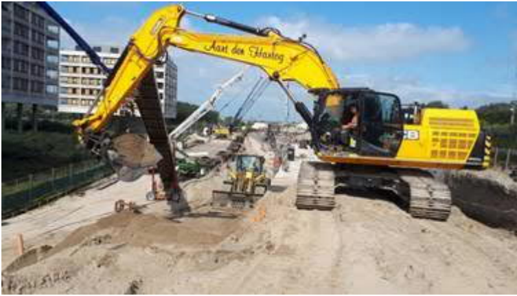
Tunnel Strandweg: aanvullen zand tunnelementen en storten beton.