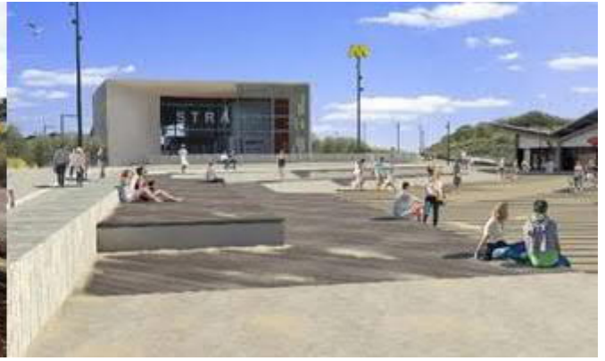
Impressie Strandplein voor station Strand