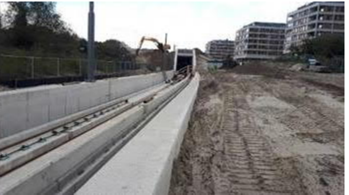
Open Bak en einde tunnel bij Paviljoensweg