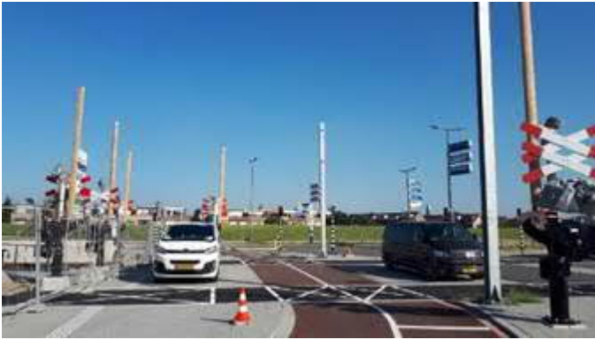
Spoorovergang Hoeksebaan - Stationsweg