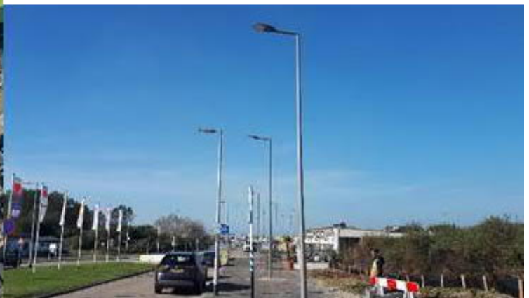
Aanbrengen verlichting langs tijdelijke route naar Badweg

Naast het vernieuwen van het Strandplein, leggen we ook een ovale rotonde (Ovonde) aan. De kruising Badweg/Strandboulevard/Koningin Emmaboulevard is nu nog onoverzichtelijk. En op drukke stranddagen loopt het verkeer hier nog wel eens vast. Door een Ovonde aan te leggen, kunnen we het verkeer beter sturen en laten doorstromen. Zo maken we de kruising overzichtelijker en veiliger.