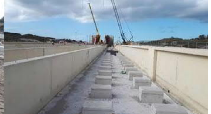
Start aanleg fietspad en onderhoudspad langs spoorbaan Blokkenspoor naast perron station Hoek van Holland Strand