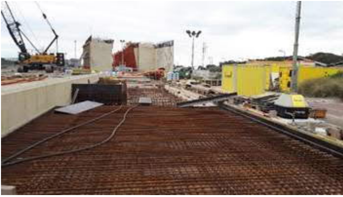
Station Hoek van Holland Strand - bouw keer- en zitelementen