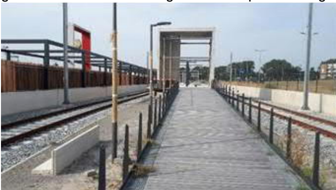
Station Hoek van Holland Haven

Momenteel worden hier diverse installaties voor het station geïnstalleerd. Dit betreft onder andere de verlichting, omroep- en camerasysteem. Ook worden in de plint van het station Hoek van Holland Haven de bestuurdersruimte en de technische ruimte afgebouwd en ingericht. Ook is deze week een aanvang gemaakt met het aanbrengen van de spoorbeveiliging bij de overweg Hoeksebaan – Stationsweg.