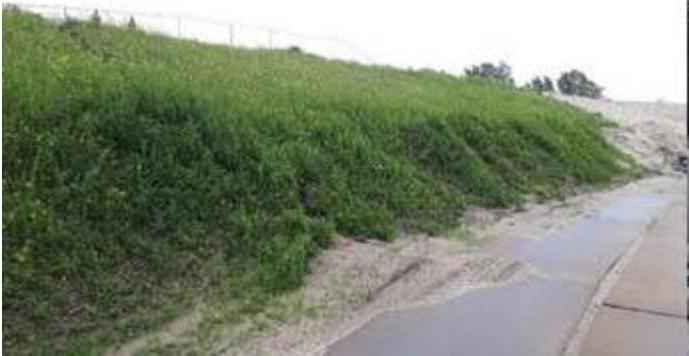
Afdekken rond tunnel Strandweg