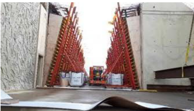
Bouw station Hoek van Holland Strand

De werktijden zijn bij station Hoek van Holland Strand aangepast in maandag tot en met vrijdag van 7.00 tot 19.00 uur. Ook zal hier op de zaterdagen gewerkt worden.