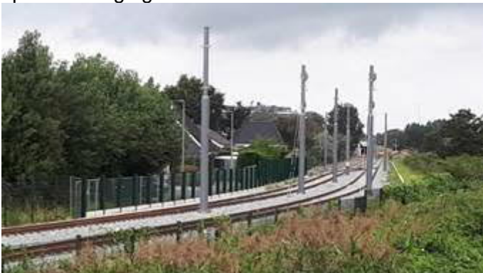
Bovenleidingsportalen in spoorbaan nabij station Hoek van Holland Haven

Hier wordt onder andere gewerkt aan de bovenleidingsportalen en de diverse kabels voor de spoorbeveiliging.