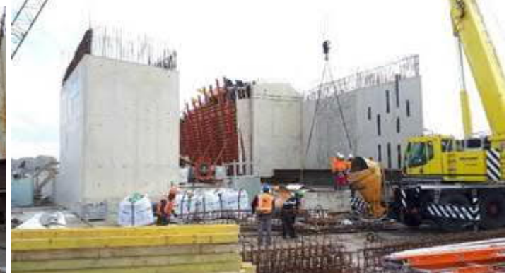
Bouw station Hoek van Holland Strand