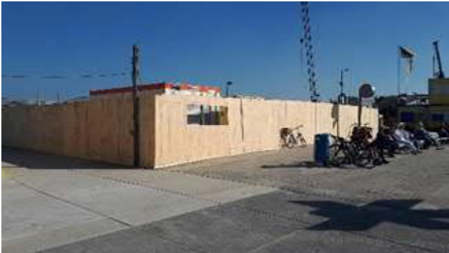
Afzetting tussen Zeekant en Strand voor bouw keer- en zitelementen