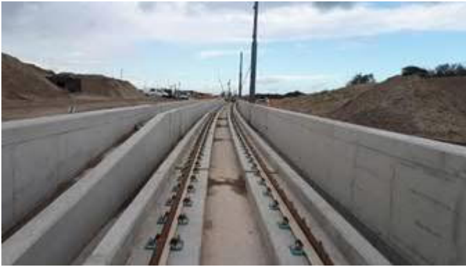
Open bak met masten bovenleiding