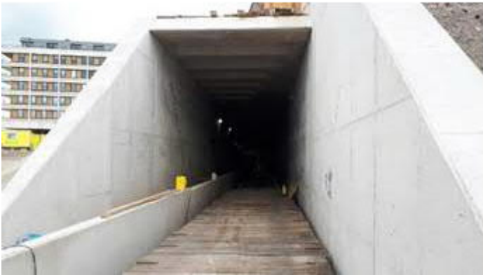
Begin tunnel Strandweg