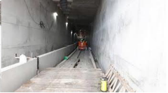
Werkzaamheden in tunnel