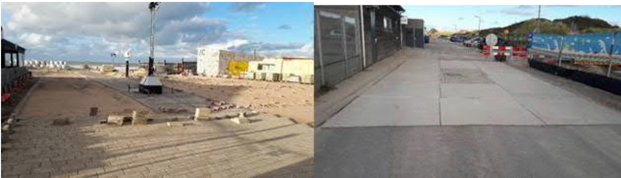
Bestrating tussen Zeekant en het strand

Tijdens de werkzaamheden aan het Strandplein en Badweg blijft de bevoorradingsroute voor de strandpaviljoens en winkels aan de Badweg/Zeekant via de Rivierkant in gebruik.