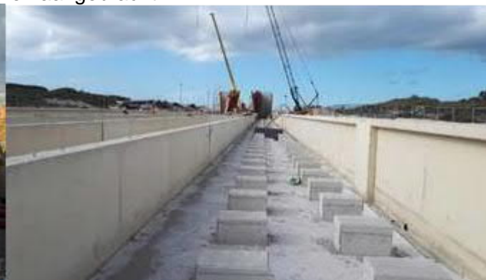
Blokkenspoor naast perron station Hoek van Holland Strand