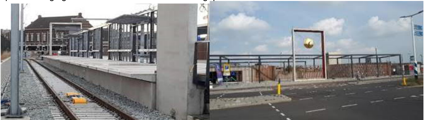
Station Hoek van Holland Haven met multiwand

Momenteel worden hier diverse installaties voor het station geïnstalleerd. Dit betreft onder andere de verlichting, omroep- en camerasysteem. De doorzichtige multiwanden op het station zijn aangebracht. Ook worden in de plint van het station Hoek van Holland Haven de bestuurdersruimte en de technische ruimte afgebouwd en ingericht. Bij de spoorovergang Hoeksebaan – Stationsweg is verder gewerkt aan de spoorbeveiliging. Ook zullen hier de schrikhekken geplaatst worden.