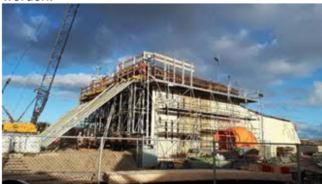
Bouw station Hoek van Holland Strand