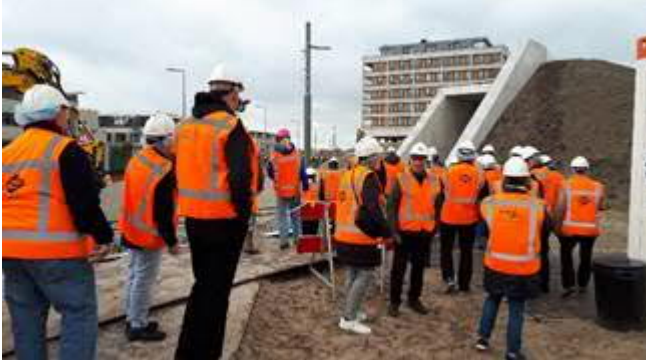
Burendag bij Metro

Afgelopen zaterdag 6 november zijn de direct aanwonenden aan het metrotracé door Metro aan zee en de Aannemerscombinatie Boskalis -Swietelsky (ABS) uitgenodigd op het bouwterrein. Zij hebben onder begeleiding vanaf de Strandweg door de "metrotunnel" naar de Paviljoensweg gelopen. Gezien de vele positieve reacties was dit voor deze bewoners een zeer bijzondere ervaring.