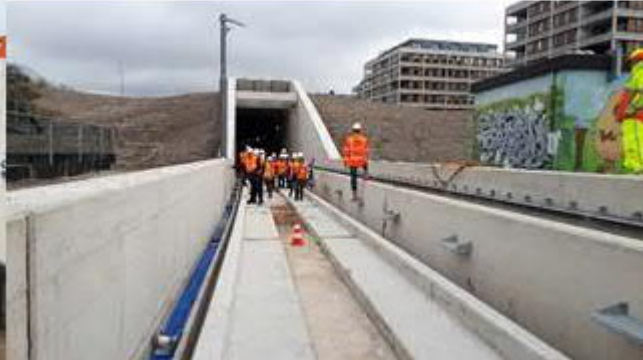
Burendag bij Metro