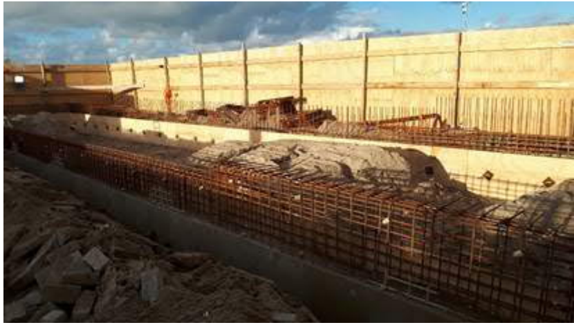
Keer en zitelement nabij het strand