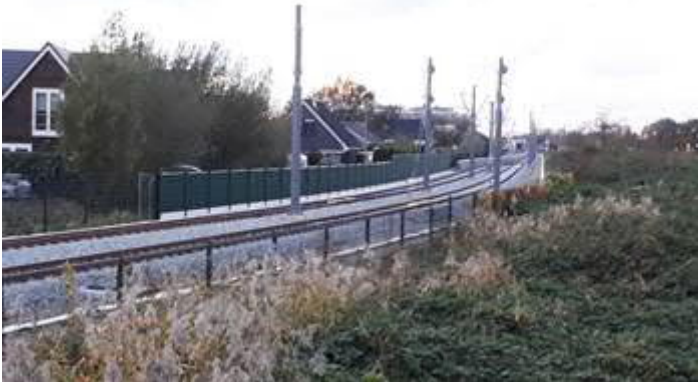
Bovenleiding en geluidscherm spoorbaan nabij station Hoek van Holland Haven

Hier wordt onder andere gewerkt aan de bovenleidingsportalen en de diverse kabels voor de spoorbeveiliging. Hiernaast zijn de cassettes in de geluidschermen aangebracht