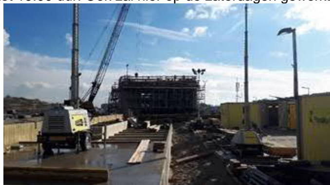
Bouw station Hoek van Holland Strand

De werktijden zijn bij station Hoek van Holland Strand aangepast in maandag tot en met vrijdag van 7.00 tot 19.00 uur. Ook zal hier op de zaterdagen gewerkt worden.