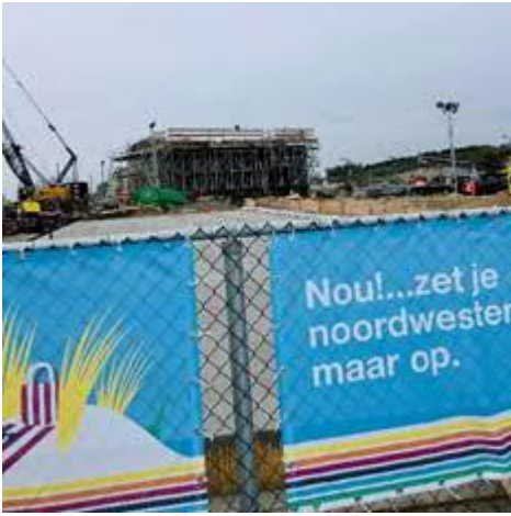
Hellingbaan naar Station Hoek van Holland Strand