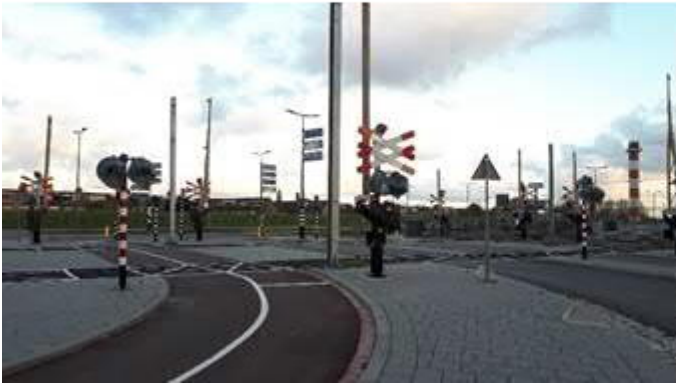
Spoorovergang Hoeksebaan – Stationsweg