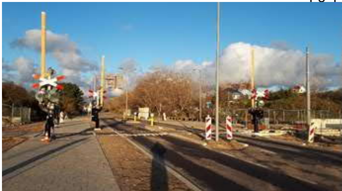
Spoorovergang Strandboulevard met spoorbeveiliging

De spoorovergang in de Strandboulevard is aangebracht. Er wordt nu gewerkt aan de spoorbeveiliging incl. slagbomen en aan het fietspad vanaf de Strandboulevard aansluitend op het fietspad in de Van Dixhoordriehoek. De asfalt-toplaag in de rijweg wordt later aangebracht. Wellicht wordt dit met de aansluitende werkzaamheden aan de Ovonde opgepakt.