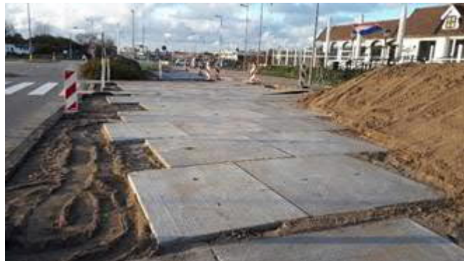
Aanleg omleidingsroute naar Badweg