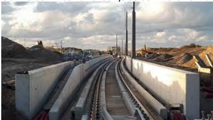
Open bak met masten bovenleiding

Aan de westzijde van de Strandboulevard wordt de rails aangebracht bij het blokkenspoor nabij het station Hoek van Holland Strand. Aan beide zijden van het blokkenspoor wordt een onderhoudspad aangelegd. Ook worden in de komende tijd de definitieve hekwerken aangebracht.