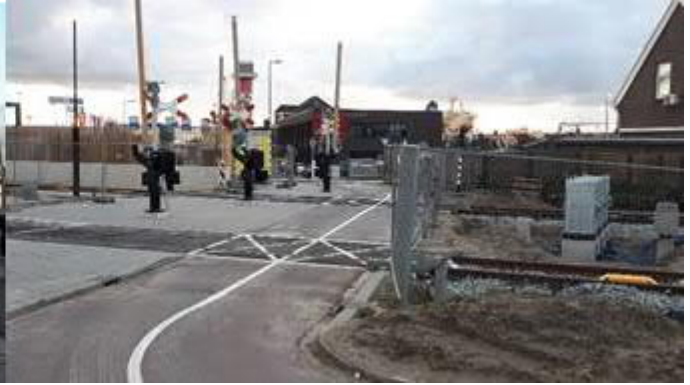
Spoorovergang Hoeksebaan/Harwichweg – Stationsweg