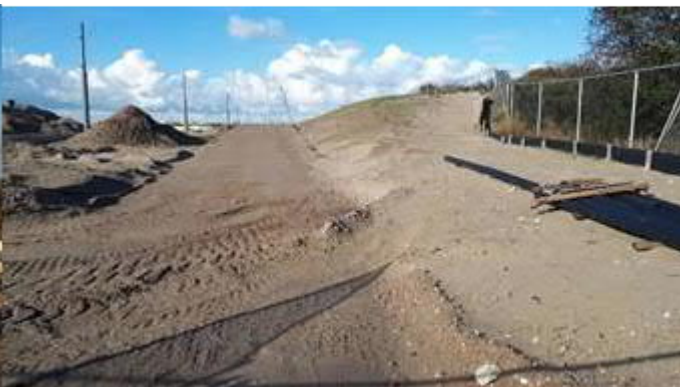
Aanleg fietspad langs spoorbaan