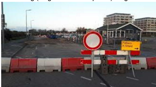
Start fase 1: Koningin Emmaboulevard

Het bestemmingsverkeer naar de Koningin Emmaboulevard wordt tijdens de werkzaamheden aan het eerste deel van de Koningin Emmaboulevard en de aanleg van de Ovonde volgens fase 1 en 2 via de Strandweg (langs Ina's Snackpaleis) omgeleid.