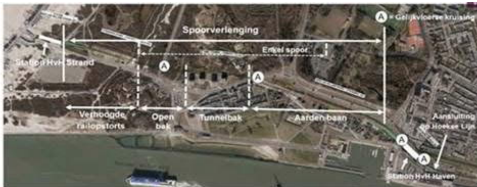
Schematisch overzicht van de werkzaamheden

De laatste twee grote buitenruimteprojecten: het nieuwe Strandplein en de ovale rotonde (Ovonde) op de kruising Badweg/Strandweg/Strandboulevard zijn volop in uitvoering.