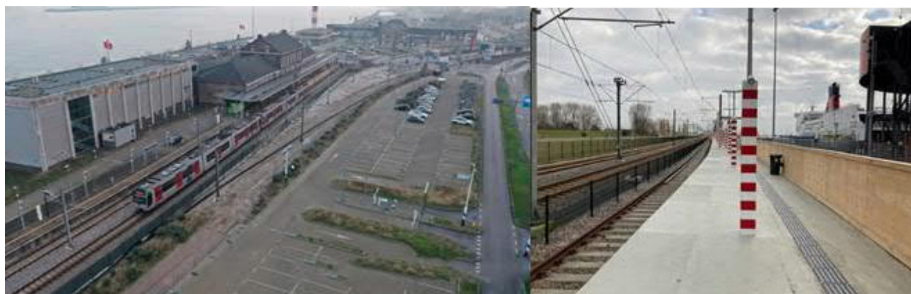
Locatie koppeling spoorverlenging op Hoekse Lijn Nieuw tijdelijk perron station Hoek van Holland Haven