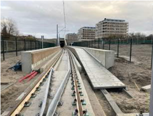
Open bak oostwestzijde Strandboulevard

Bij de spoorwegovergang in de Strandboulevard wordt in de komende tijd de laatste hand gelegd aan de spoorbeveiliging, voor zover dat buiten kan (ondertussen wordt ook gewerkt aan de software). Het fietspad vanaf de Strandboulevard aansluitend op het fietspad in de Van Dixhoorndriehoek is aangelegd (maar nog niet opengesteld). Hier dienen eerst de definitieve hekwerken langs de spoorbaan geplaatst te worden.