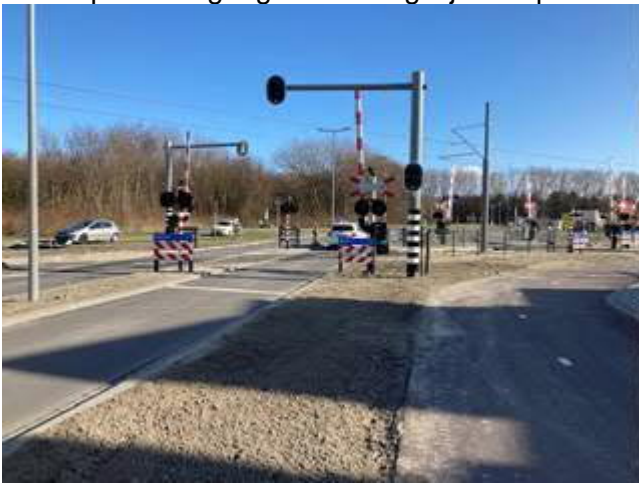
Spoorovergang Strandweg met file lichten

Hier worden de bermen in de spoorbaan afgewerkt zodat deze kunnen worden ingeplant en ingezaaid. In de spoorovergang Strandweg zijn de spoorhekken en de file verkeerslichten aangebracht.