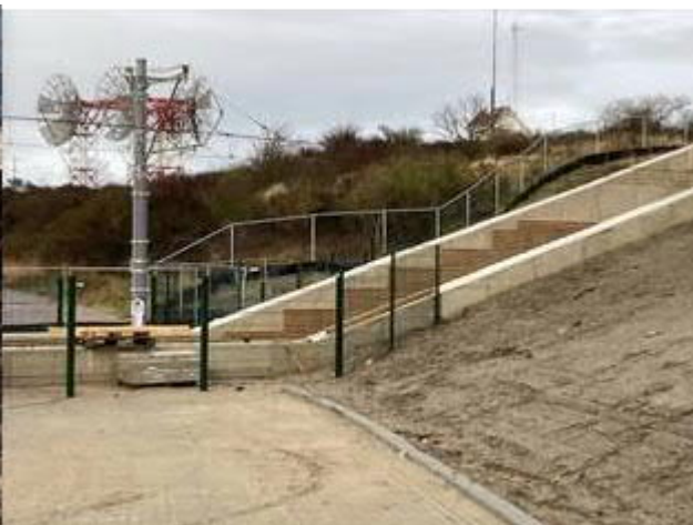
Westzijde tunnel nabij Strandboulevard