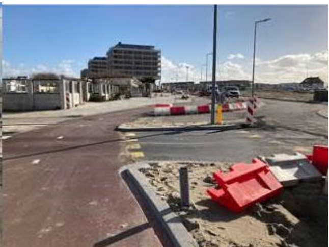
Spoorovergang Strandboulevard en aansluiting op Ovonde