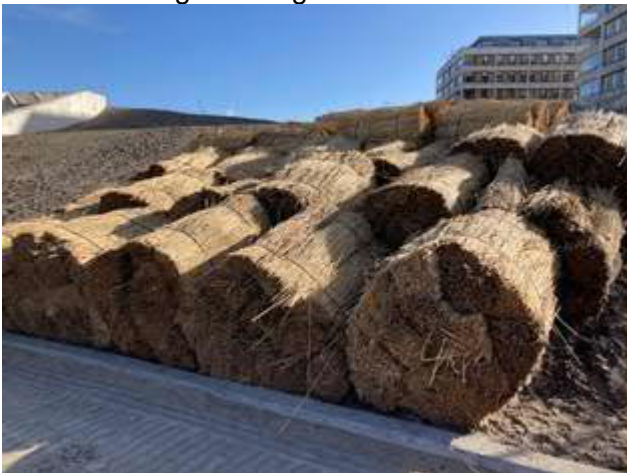
Rietpollen tegen verstuiwing vanaf tunneldak

De geluidwerende beplating is in de afgelopen tijd in de open bak en de tunnelmonden aangebracht. Na het afdichten van de ventilatieopening in het dak van de tunnel wordt nu de beplanting aangebracht op het tunneldak. Deze week is de duindoorn aangeplant. In de komende week wordt gestart met het aanbrengen van rietpollen. Deze rietpollen worden aangebracht om stuiven tegen te gaan omdat de duindoorn nog niet volgroeid is.