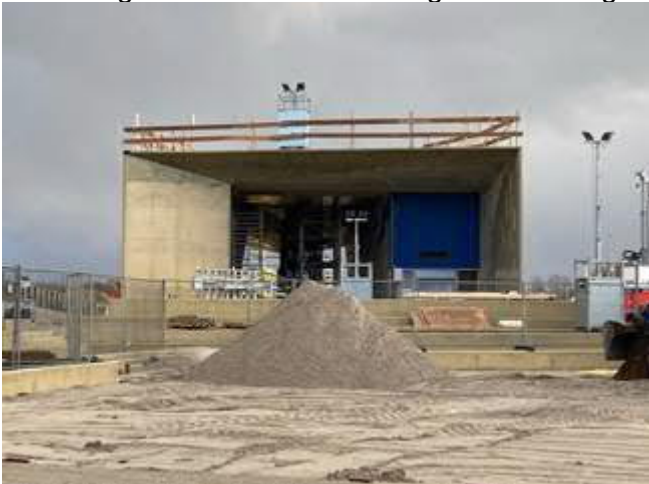
Voorzijde station Hoek van Holland Strand

Na de afronding van de ruwbouw van het station Hoek van Holland Strand worden de laatste bekistingen verwijderd. Vervolgens worden de wanden afgewerkt en het herstelplan voor de betonnen buitenwanden uitgevoerd. Hierna wordt het visgraatmotief geschilderd wordt de glazen pui worden gemonteerd. Ook wordt er gewerkt aan de inrichting en afwerking van de RET-bestuurders- en kelderruimte.