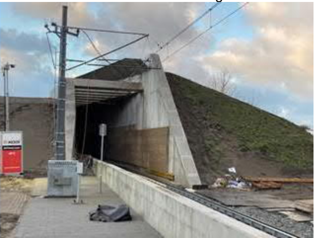
Oostzijde tunnel nabij Strandweg