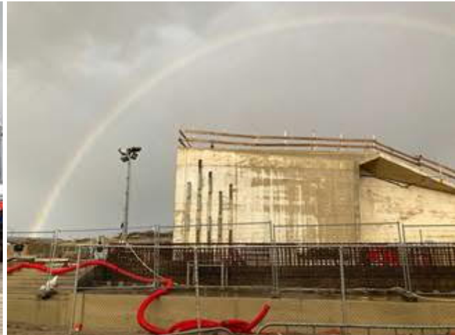
Zijkantaanzicht Station Hoek van Holland Strand