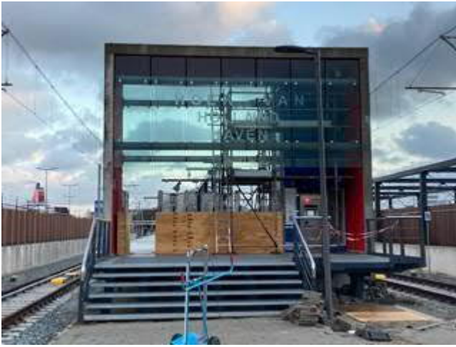
Station Hoek van Holland Haven (westzijde)