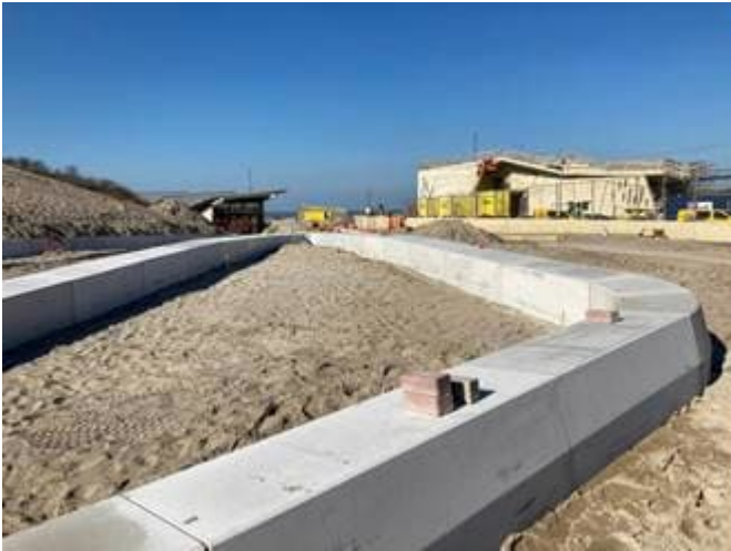
Betonbanden strandslag naast station Strand