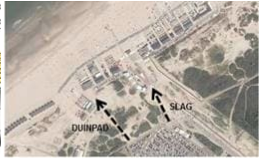
Voetgangers via Duinpad i.p.v. Slag