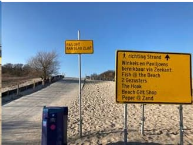
Verbrede Duinpad tussen parkeerterrein en strand