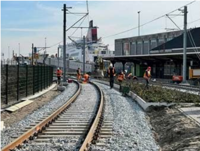
Koppeling spoorverlening op Hoeksebaan