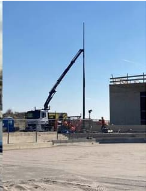
Lichtmasten voor Station Hoek van Holland Strand