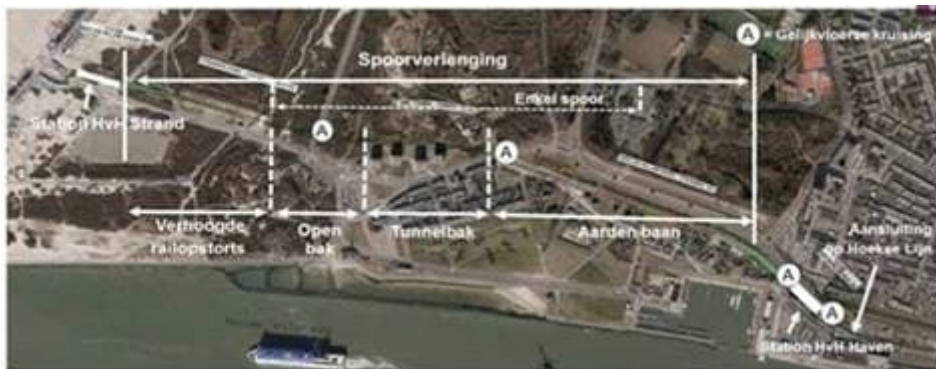
Schematisch overzicht van de werkzaamheden

De laatste twee grote buitenruimteprojecten: het nieuwe Strandplein en de ovale rotonde (Ovonde) op de kruising Badweg/Strandweg/Strandboulevard zijn volop in uitvoering.