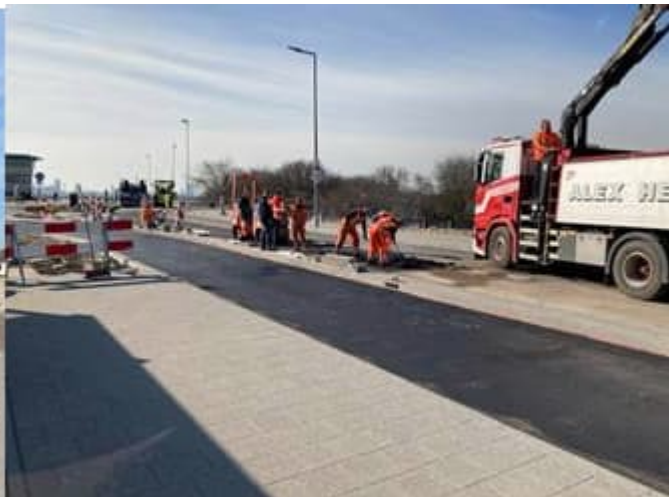
Asfalteren fietspad en rijbaan Koningin Emmaboulevard ter hoogte van aansluiting Strandweg