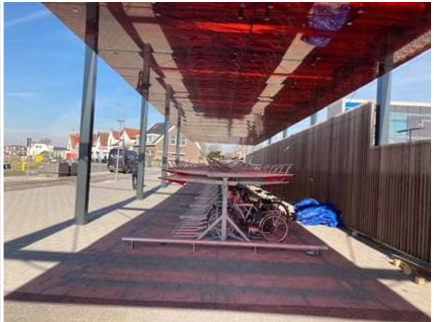
Looproute naar nieuw tijdelijk perron station Haven