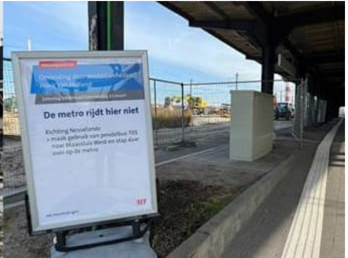
Opbreken oude spoorlijn bij NS perron