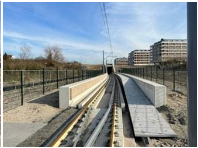
Open bak oostzijde Strandboulevard