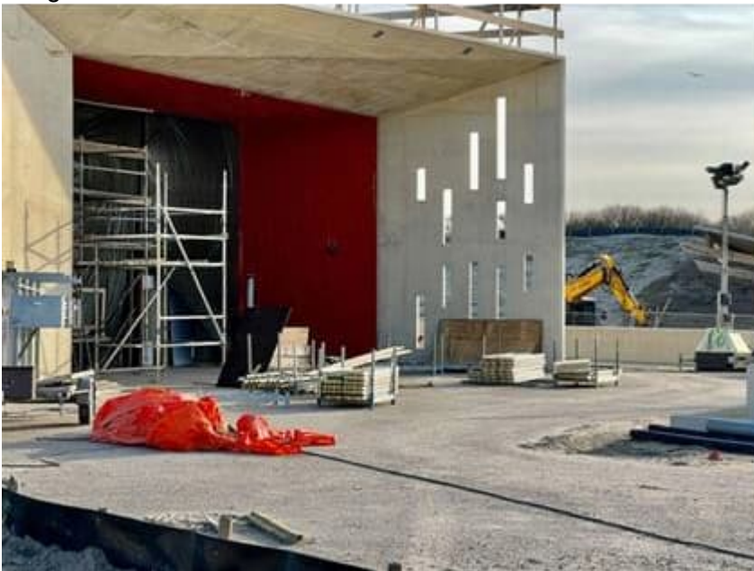
Geschilderde entree station Hoek van Holland Strand

Het station Hoek van Holland Strand wordt momenteel verder afgewerkt. Zo wordt er gewerkt aan de afwerking van wanden en vloeren, het plaatselijk herstel van betonnen wanden en dak, het verven van het vismotief, en het aanbrengen van de glazen pui bij de entree van het station. Ook wordt de laatste hand gelegd aan het testen van de systemen en de afwerking van het trappenhuis, kelderruimte en RET-bestuurdersruimte. In de komende weken wordt op het perron het glas in deabri's en de verlichting hierin aangebracht.