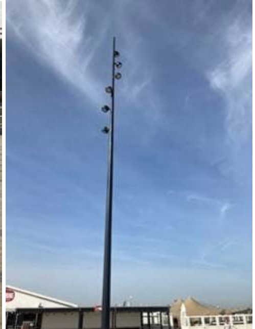
Lichtmasten op Strandplein