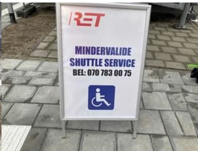
Infobord Minder Valide shuttle