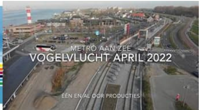
Vogelvlucht april 2022

Voor vragen of opmerkingen over deze werkzaamheden kunt u met mij contact opnemen.