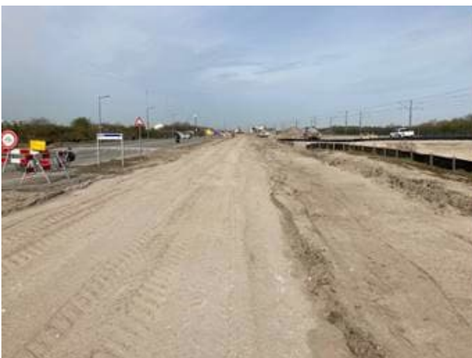
Werkzaamheden voet- en fietspad Badweg

De beplanting van de groenstrook tussen voet/fietspad langs de Badweg en spoorbaan wordt komend najaar aangebracht. Na Hemelvaart zullen er op het strandplein plaatselijk tegels vervangen worden door witte glinsterende tegels.