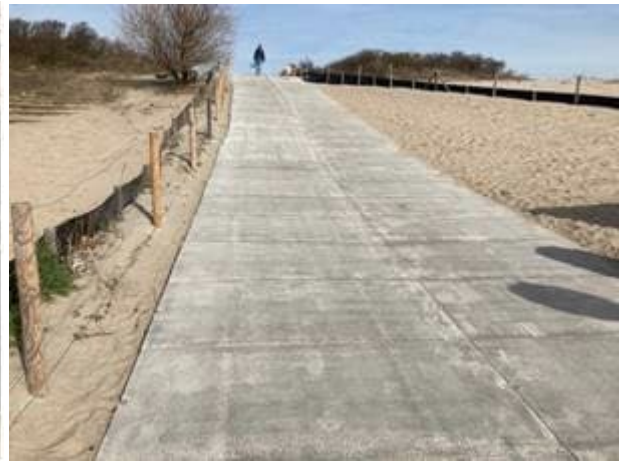
Voetgangers via het duinpad en het Slag