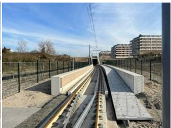
Open bak oostzijde Strandboulevard