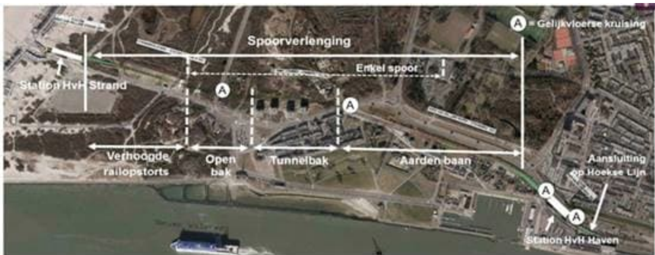
Schematisch overzicht van de werkzaamheden

In de laatste vlog van Metro aan Zee wordt antwoord gegeven op de vraag: “Waar wachten we op?”