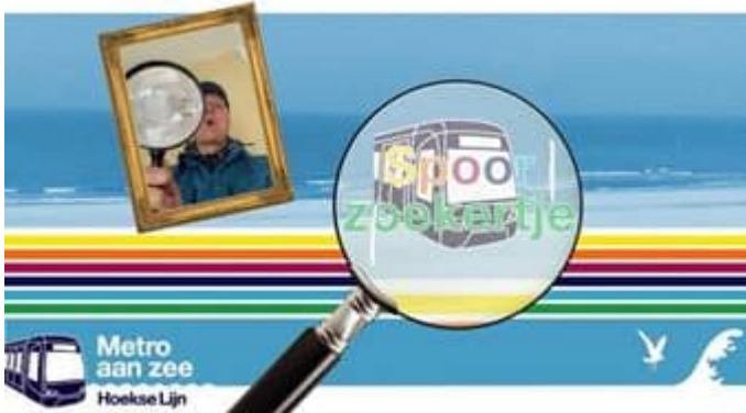
Vlog Metro aan Zee