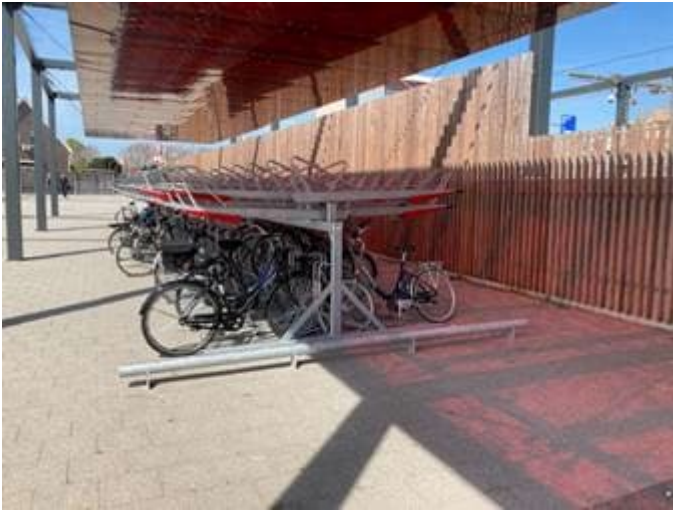
Overdekte fietsenstalling Stationsweg