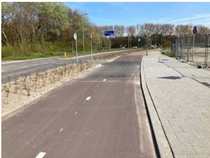
Strandweg – herstel asfalt