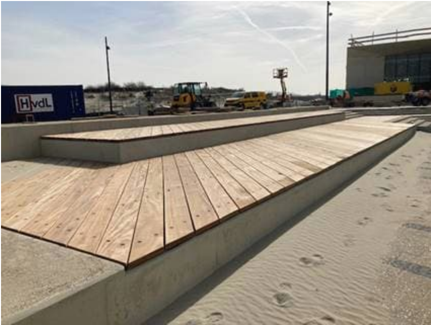
Houten zitelementen voor station Hoek van Holland Strand