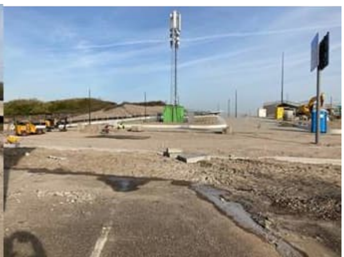
Werkzaamheden Badweg nabij Strandslag