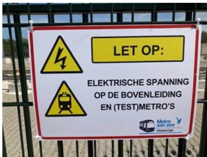
Waarschuwingbord metrobaan Metro aan Zee