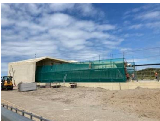
Betonherstel station Hoek van Holland Strand

Na de geslaagde dynamische testen zijn de herstelwerkzaamheden en restpunten aan Station Strand weer opgepakt. Het betonherstel aan de buitenwanden is afgerond. In juli worden de vloer, wanden en binnenzijde van de voetgangerstoegang afgewerkt. Ook wordt een anti-graffiti laag aanbracht. Na de restwerkzaamheden aan de buitenzijde van het station, worden de steigers verwijderd en kan de stroom weer op de bovenleiding voor de start van het proefbedrijf.