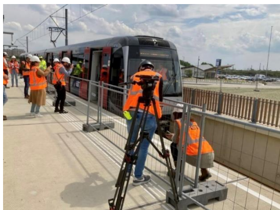
Testrit met pers, 31 mei 2022

In de maanden mei en juni zijn twee vlogs en een dronefilm gepubliceerd: