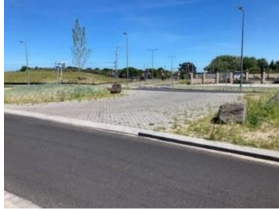
Bypass Ovonde