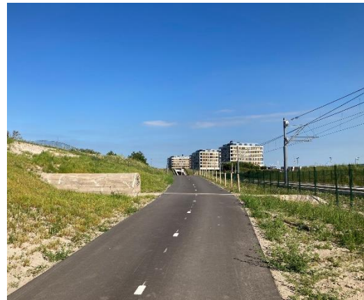
Fietspad dat Atlantikwall doorkruist