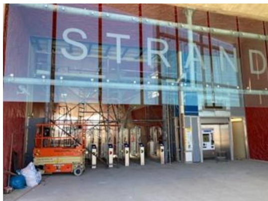
Entree station Hoek van Holland Strand