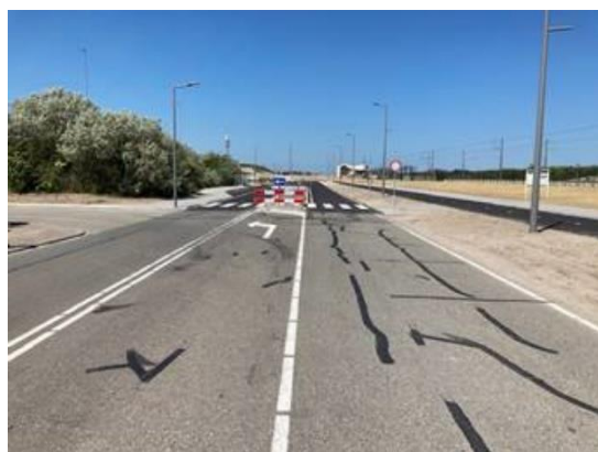
Oude situatie Badweg

Om eenheid in uitstraling in het gebied te creëren, is de Badweg aangepakt. Deze is opnieuw geasfalteerd. De groenvoorziening tussen de Badweg en de spoorbaan, wordt eind dit jaar uitgevoerd.