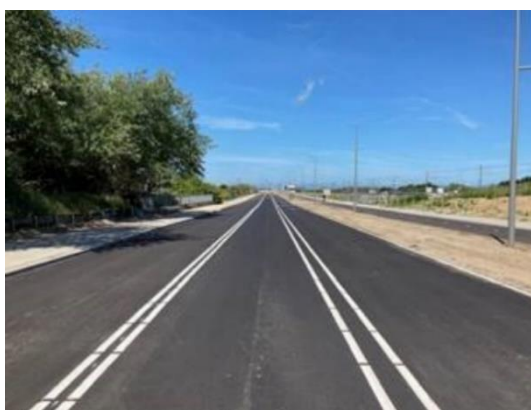
Nieuwe situatie Badweg